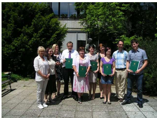
Slika: Prvi diplomanti študijskega programa Gostinstvo in turizem na VSŠ Grm Novo mesto – center biotehnike in turizma, s svojimi mentorji, predsednico študijske komisije in ravnateljico VSŠ.