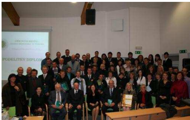
Slika (levo): Podelitev diplom diplomantom (18. 10. 2011) – diplomanti s sodelavci VSŠ

Poleg slavnostne podelitve diplom so bili podeljeni tudi Certificati »zaupanja vreden« študentom, ki so si jih prislužili za uspešno izvedbo projektnih nalog.