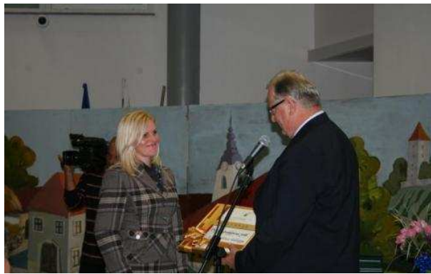
Slika (desno): Podelitev priznanja MO NM VSŠ Grm Novo mesto za 10 let delovanja