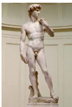
Slika 7: David, Michelangelo

Tudi za renesančno kiparstvo je bilo značilno posnemanje narave, priljubljeni so bili portreti in kipi golih teles. Portreti so bili tudi glavna tema v renesančnem slikarstvu