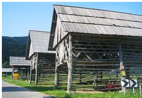
Slika 4: Dvojni kozolci pred vasjo Studor