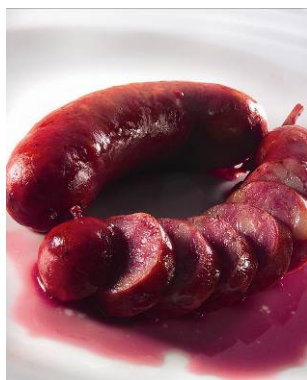
Slika 5: Kranjska klobasa