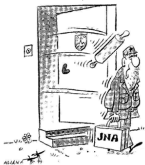
Slika 2: Osamosvojitvev Slovenije Vir: Sajovic, 1999.

25. junija slovenski parlament sprejme Deklaracijo o neodvisnosti. Naslednji dan je na Trgu revolucije (današnjem Trgu republike) ob prisotnosti navdušenih množic razglašena samostojnost Republike Slovenije, na drogu pred parlamentom pa zavihra nova slovenska zastava. Preleti vojaških letal že med prireditvijo napovedujejo vojaški spopad, ki se v naslednjih dneh odvija na mejnih prehodih, v okolici vojašnic in ob zaporah cest. Maloštevilni pripadniki teritorialne obrambe in policija z ovirami in blokadami ustavijo jugoslovansko vojsko (prirejeno po Vidic, 1999).