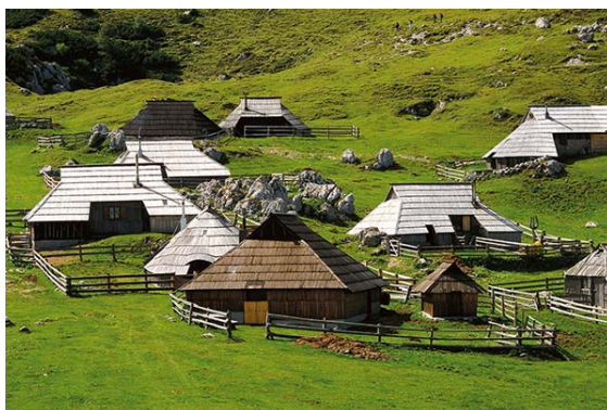
Slika 3: Velika planina – sožitje človeka z naravnim okoljem

K človekovemu »oblikovanju« dediščine naravnega okolja v alpskem svetu moramo šteti tudi površine z visokogorsko, planinsko pašo - planine, ki so najpogosteje povezane z občasnimi bivališči, pastirskimi kočami - stanovi, bajtami, planšarijami, kakor jih na posameznih področjih imenujejo. Tu so še bivališča za živino, planinski hlevi, staje, tamarji, hudrti... Drugo obliko alpskega okolja, predstavljajo samotne visokogorske kmetije in manjši zaselki. Vsaka kmetija je bila (in je delno tudi še danes) nekakšna vas v malem, saj je morala vsebovati poleg svojih siceršnjih funkcij še številne druge, ki so se v dolinskih naseljih razvile v oblike »servisov« za vse prebivalce. V sodobnem času zelo radi govorimo o bolj ali manj pristnem stiku z naravo. Pri tem pogosto stopamo v pretiravanja in stereotipe. Vendar moramo za te samotne kmetije in njihove prebivalce izpostaviti prav to razsežnost. V pristnem stiku človeka z naravo oz. povezanosti človeka in naravnega okolja so skrita številna alternativna ekološka sporočila za sodobni čas, saj je potrebno izpostavljati predvsem prednosti bivanja v tem svetu. Seveda tudi s trdnimi ekonomskimi motivi (Bogataj, 1992).